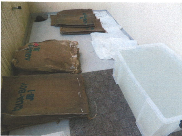
容器に塩化カルシウム10%溶液を作り脱水